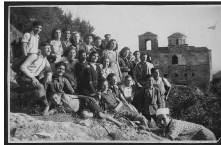
Ил. 8. Ученици от арменското училище в Пловдив на излет до Асеновата крепост, 1942 г.

В същото време тоталитарната държава извършва централизация на политическата, културната и просветната дейност на арменските дружества. Разформироваха се съществуващите до момента организации, редица от които са обявени за „фашистки“ и „контрареволуционни“, и е конфискувано имуществото и документацията им. Още през октомври 1944 г. се създава Културно-просветното дружество „Ереван“, което заема мястото на учредения на 21 септември с.г. Временен централен комитет на ОФ. Това Дружество има за цел да концентрира и в голяма степен да контролира дейността на арменската общност. Негови клонове се създават и в останалите градове с големи арменски общности – Пловдив, Варна и Русе.