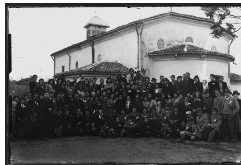
Ил. 7. Арменци в двора на арменската църква в Силистра, 15 август 1941 г.

те в Диарбекир, подкрепата на арменците за създаването на Българската екзархия, спасяването на българи по време на Руско-турската освободителна война и др. Българите, от своя страна, също проявяват съчувствие и подкрепа към подложените на преследване и убийства арменци като организират митинги в тяхна защита, подпомагат преминаването им в България и съдействат на много от желящите бежанци да се установят в страната.