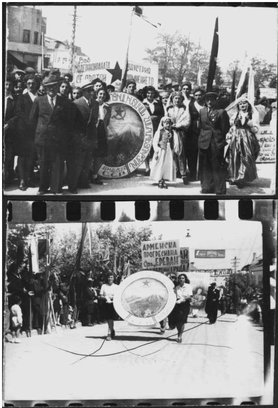
Ил. 9 и ил. 10. Манифестация в Силистра с участието на певческия хор, танцовия състав и други представители на Арменската прогресивна организация „Ереван“, 1945 г.