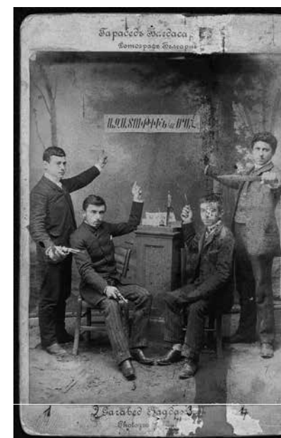
Ил. 5. Членове на арменски социалистически кръжок, 1888-1889 г.

банки – Кооперативна (популярна) банка „Тракия“ и Арменска популярна банка „Севан“.