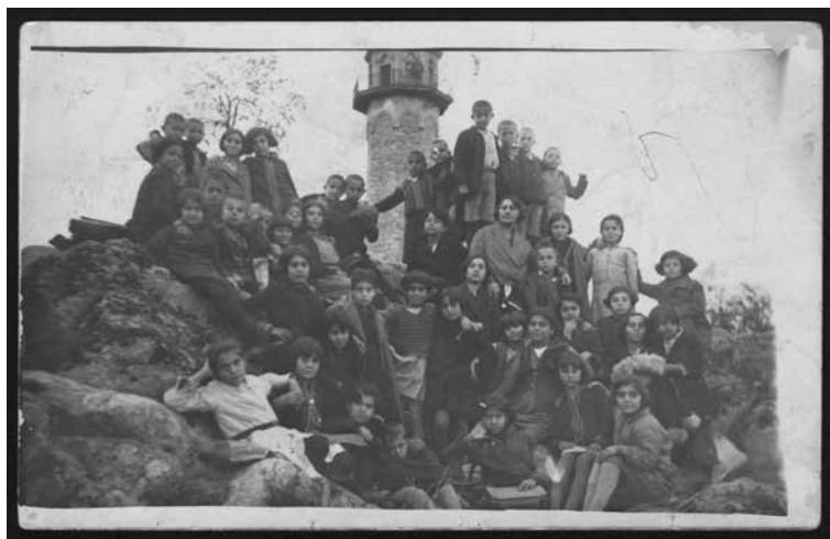
Ил. 6. Ученици от арменското училище в Пловдив на излет по Сахат тепе, 1931 г.

да допринасят също така преводите на български автори (например Любен Каравелов, Захари Стоянов, Пейо Яворов) на арменски език и на арменска литература на български език (един от първите известни преводачи от арменски е Димитър Полянов).