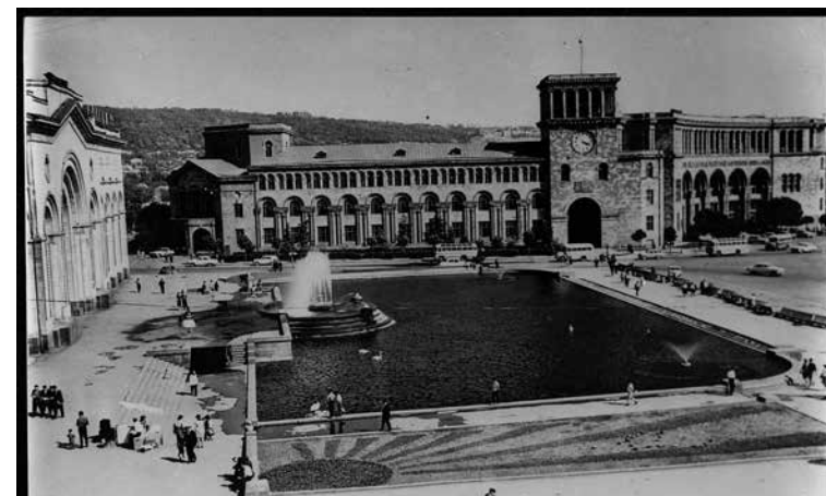
Ил. 12. Правителствения дом в Ереван, Арменска ССР, 1965 г.

Въпреки че в документите този процес по изселването е определян като „доброволен“ и е представян като желание на заминаващите за завръщане в историческата им родина, не може да се подмине фактът, че се полагат систематични усилия в различни посоки за улесняване и насърчаване на това изселване. Дори през 1955 г., т.е. близо седем години след спиране на процеса по репатриране, дружество „Ереван“ продължава да се опитва да изпрати в Съветска Армения членове на арменски семейства, които поради отменяне на репатрираните са останали в България. Не е допуснат обаче дори намек за възможност за изселване в друга държава. Нещо повече – тези, които си позволяват да критикуват изселването, ги грози интерниране в трудов лагер, каквито случаи има регистрирани в по-горе цитираните документи. Като част от мероприятията комитетът по репатриацията организира редица добре разгласени разяснителни събрания сред общността, които имат за цел да мотивират възможно повече български арменци да предприемат тази стъпка.