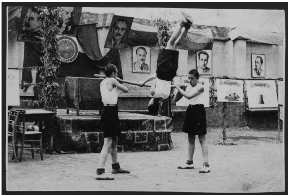
Ил. 11. Гимнастически упражнения по време на пионерско тържество в двора на арменското училище в Пловдив, 1947 г.

Кайро с централа за Европа, намираща се в Париж, и главна квартира в Ню Йорк (известно е като Armenian General Benevolent Union). Първият клон това дружество в България е създаден още през 1910 г. в Пловдив. След 1944 г. една от основните му дейности е събиране на помощи за храна и пътни разходи за заминаващите за Съветска Армения. „Парекордзаган“ успява да набере значителни суми за целта в периода 1946-1948 г. и най-вероятно това е причината, поради която властите си затварят временно очите пред продължаващата му дейност. Независимо от това на организацията се гледа с голямо недоверие, недвусмислено изразено в твърдения от доклади на ДС, че тя „под прикритието на помощи върши своята гадна шпионска дейност“. Потвърждение за подобна вражеска дейност се търси в това, че дружеството подканяло арменците, които са получили помощи, да изпращат групови благодарствени писма до Съединените щати 5 .