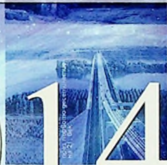
Балкани на 21. Век Съставители: Александър Костов, Екатерина Николова