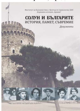
фиг. 2 Корица на българското издание