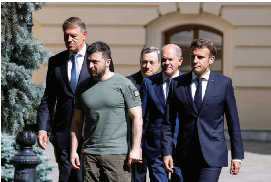
На 16 юни 2022 г. румънският президент Клаус Йоханис (вляво) заедно с други европейски лидери се среща в Киев със своя украински колега Володимир Зеленски

добряване и на румънско-украинските отношения, потвърждение за което е интензивният двустранен диалог. Сред най-важните моменти в него са посещенията на украинския министър на външните работи Дмитро Кулеба в Букурещ на 22 април 2022 г.; посещенията на румънска делегация начело с министър-председателя Николае Чука и президента на Камарата на депутатите Марчел Чолаку в Киев на 26 април 2022 г.; участието на румънския премиер в срещата на върха на международната Кримска платформа на 23 август 2022 г. Особено място в динамиката на отношенията между двете държави заема посещенията на президента Клаус Йоханис в Киев на 16 юни 2022 г. заедно с президента на Франция, канцлера на Германия и министър-председателя на Италия, което цели да покаже европейското единство пред лицето на руската агресия и в подкрепа на Украйна. Същевременно то е свидетелство за утвърждаването на Румъния като значим регионален фактор в политиката на ЕС по отношение на Украйна.