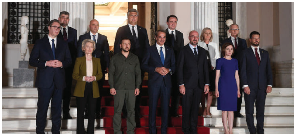
На неформална среща на ЕС с десет страни от Югоизточна Европа през август 2023 г. в Атина е приета декларация в подкрепа на Украйна

С този политически товар сръбският президент Александър Вучич отива на неформалната среща на ЕС с десет страни от Югоизточна Европа в Атина на 21 август 2023 г. Участниците в срещата приемат декларация в подкрепа на Украйна и на нейната евроинтеграция. Вучич подписва документа, като претендира пред вътрешните си критици, че по искане на Сърбия са отпаднали текстове, които съдържат името на Владимир Путин, и в които се говори за военни престъпления.