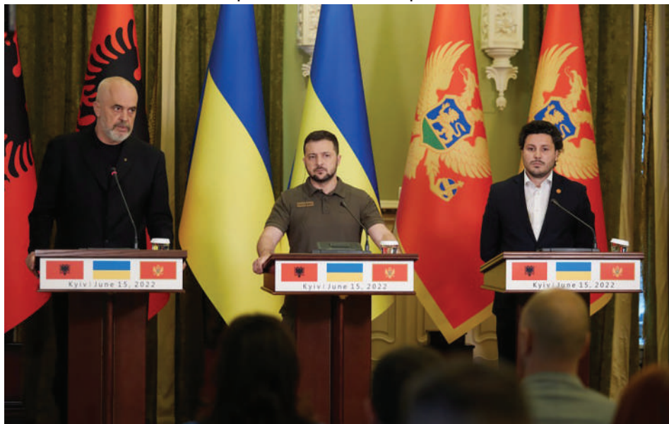
През юни 2022 г. черногорският премиер Дритан Абазович (вдясно) е в Киев заедно с албанския си колега Еди Рама. Двамата дават пълната си подкрепа за Украйна срещу Русия.

ция с украинския президент Володимир Зеленски на 15 юни Дритан Абазович заявява, че „съдбата на Украйна може да постигне и страните от Западните Балкани, поради което ЕС трябва да прояви солидарност и загриженост, като ускори процеса на евроинтеграцията“ както на балканските страни, така и на Украйна.