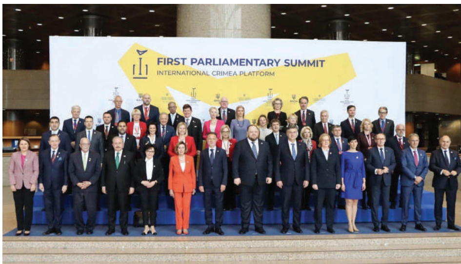
Първа парламентарна среща на „Кримска платформа“, 2023 г.