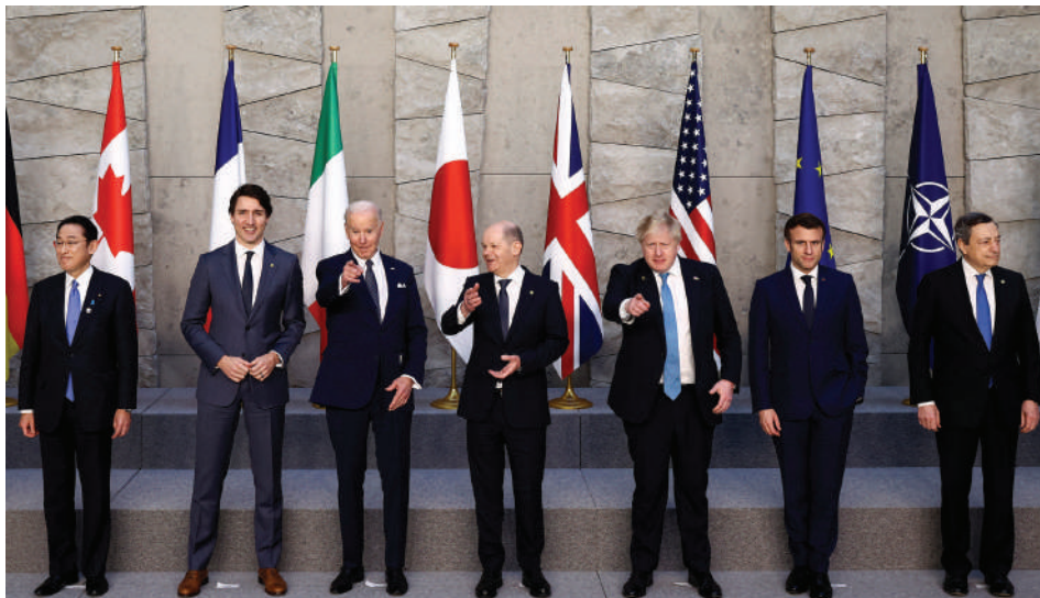
На срещата на НАТО в Брюксел през март 2022 г. е обявено създаването на четири нови многонационални бойни групи в България, Словения, Унгария и Румъния

създаването на четири нови многонационални бойни групи в България, Словения, Унгария и Румъния 12 . Три месеца по-късно, в края на юни на срещата на върха на НАТО в Мадрид се приема и новата стратегическа концепция на съюза и увеличаване на многонационалните групи в Източна Европа от батальон до размера на бригада и нарастване на силите за бързо реагиране от 40 000 до 300 000 души 13 . За разлика от стратегическата концепция от 2010 г., където сътрудничеството НАТО-Русия е от „стратегическо значение, тъй като допринася за създаването на общо пространство на мир, стабилност и сигурност“ 14 , тази от 2022 г. вече посочва Руската федерация като „най-значимата и пряка заплаха за сигурността“ на евроатлантическата зона. Паралелно с това в Мадрид Западните Балкани и Черноморския регион са посочени като зони от „стратегическо значение“ за Алианса 15 .