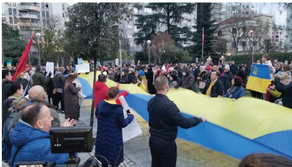
Демонстрация в подкрепа на Украйна в албанската столица Тирана

Тук бих искал да се спра накратко и върху част от темите, предвидени за разискване в дискусиата, тъй като тяхното разглеждане внася допълнителна яснота за отношението на Албания към войната в Украйна и нейното въздействие върху страната и нейната политика. Разбира се, краткото време, предоставено на всеки участник, ме принуждава да бъда максимално пестелив в характеристиките и тяхното евентуално разясняване – където то е необходимо.