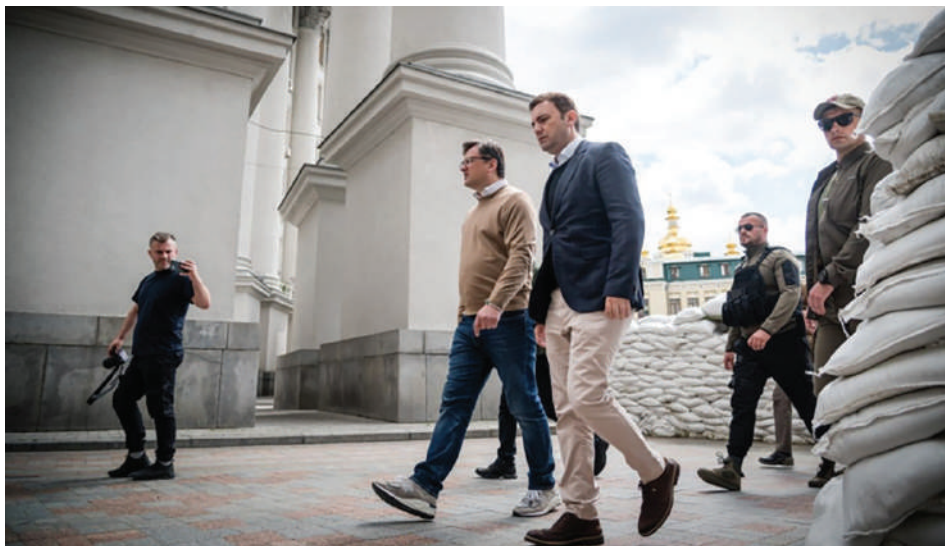
През май 2022 г. външният министър на Северна Македония Буяр Османи (вдясно) посещава Киев и град Ирпин

Вече в качеството си на председател на Организацията за сигурност и сътрудничество в Европа (ОССЕ) от началото на 2023 г., Буяр Османи отново посещава Украйна. Визитата му в Украйна на 16 януари е в рамките на реализацията на един от основните приоритети на председателството на Република Северна Македония на ОССЕ през 2023 г., в който фокусът е поставен върху „работата на терен и за хората, които са най-засегнати от военната агресия“.