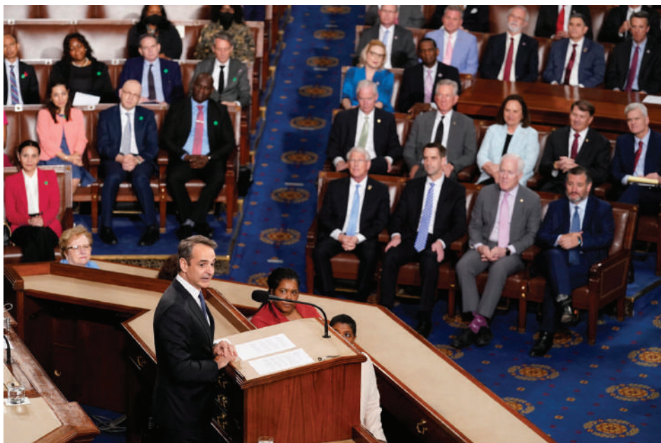
През май 2022 г. гръцкият премиер Константинос Мицотакис прави обръщение към Конгреса на САЩ

важността на Гърция като американски съюзник, предвид кризата в Украйна. Безспорният връх в гръцко-американските отношения обаче идва в средата на май 2022 г., във връзка с решението на гръцкия парламент от 12 май да ратифицира Втория протокол за изменение на договора за военно сътрудничество САЩ-Гърция. В подкрепа на законопроекта гласуват 181 депутата [157 от управляващата „Нова демокрация“, 22 от Движението за промяна (КИНАЛ) и двама независими], а 119 депутата гласуват против [от Коалицията на радикалната левица (СИРИЗА), партията „Гръцко решение“, Гръцката комунистическа партия и Европейския фронт за реалистично неподчинение (MePA25)] 6 . Само четири дни по-късно премиерът Кириакос Мицотакис се среща във Вашингтон с президента на САЩ Джо Байдън, за да препотвърди стратегическите отношения между двете страни и ролята на Гърция като утвърждаващ се енергиен център в региона, а на следващия ден става първият гръцки министър-председател на правил обръщение към Конгреса на САЩ.